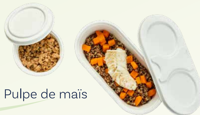
Pulpe de maïs